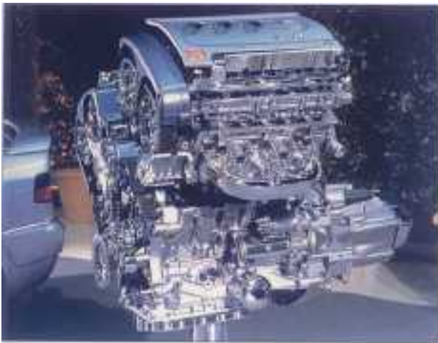
Présentation de la Xantia V6 Activa organisée fin 1996 par Citroën. Même en coupe, le V6 a des arguments. Presque une oeuvre d'art.